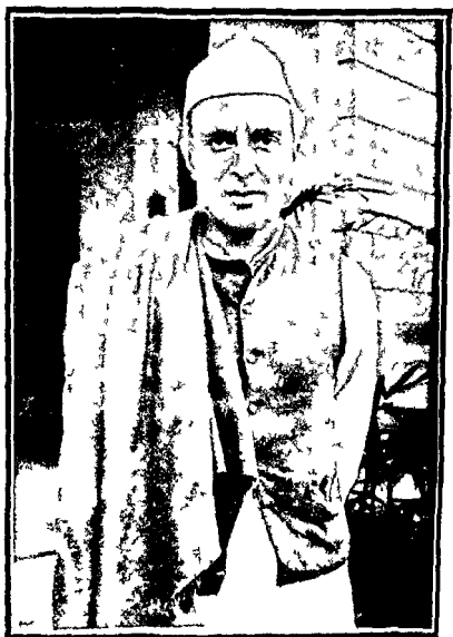
पंडित जवाहरलालजी नेहरु